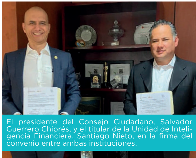
El presidente del Consejo Ciudadano, Salvador Guerrero Chiprés, y el titular de la Unidad de Inteligencia Financiera, Santiago Nieto, en la firma del convenio entre ambas instituciones.

El combate contra la Trata de Personas requiere de esfuerzos y efectos transversales. Con esa claridad el Consejo Ciudadano establece alianzas con autoridades y organismos sociales, tanto nacionales como internacionales.