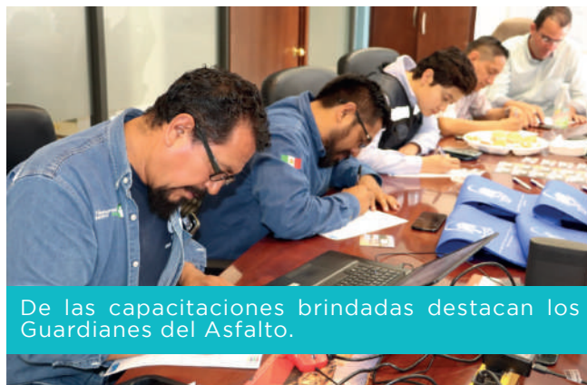
De las capacitaciones brindadas destacan los Guardianes del Asfalto.

Prevenir el delito de Trata es entender su dinámica y difundirla con la finalidad de acercar el conocimiento a las personas y minimizar los riesgos de que sean víctimas.