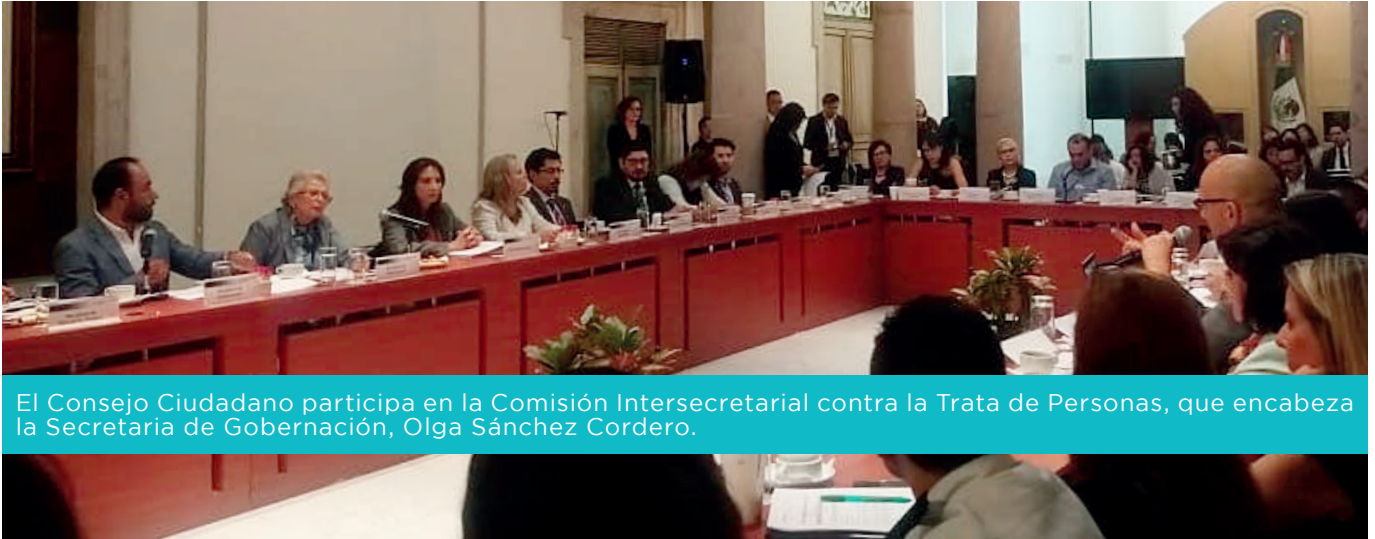
El Consejo Ciudadano participa en la Comisión Intersecretarial contra la Trata de Personas, que encabeza la Secretaría de Gobernación, Olga Sánchez Cordero.

Como parte de ese trabajo, el Consejo participó en la elaboración del Programa Nacional para Prevenir, Sancionar y Erradicar los Delitos en Materia de Trata de Personas y para la protección y asistencia a las víctimas de estos delitos 2019-2024.